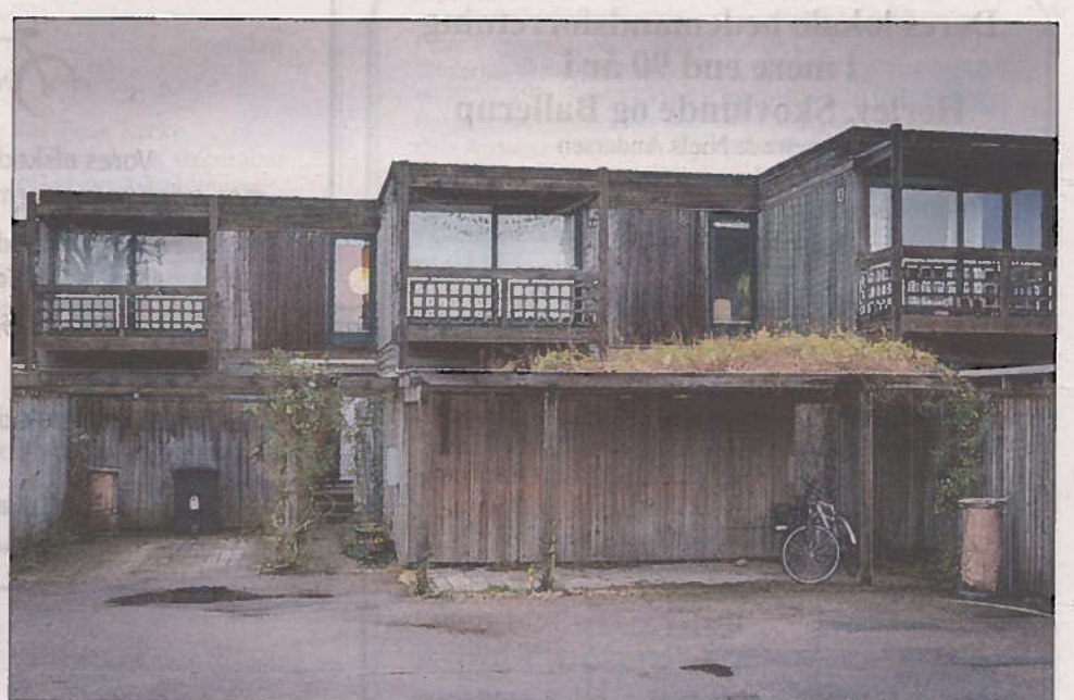
NATUR. Cowboybyen tager sig godt ud - især om sommeren, hvor der er grønt på og omkring husene.